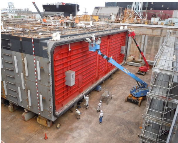
2号函端部鋼殻ゴムガスケット固定