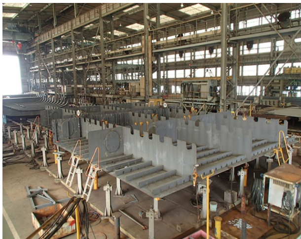
2号函鋼殻ブロック製作中