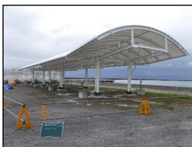
新設上屋製作完了